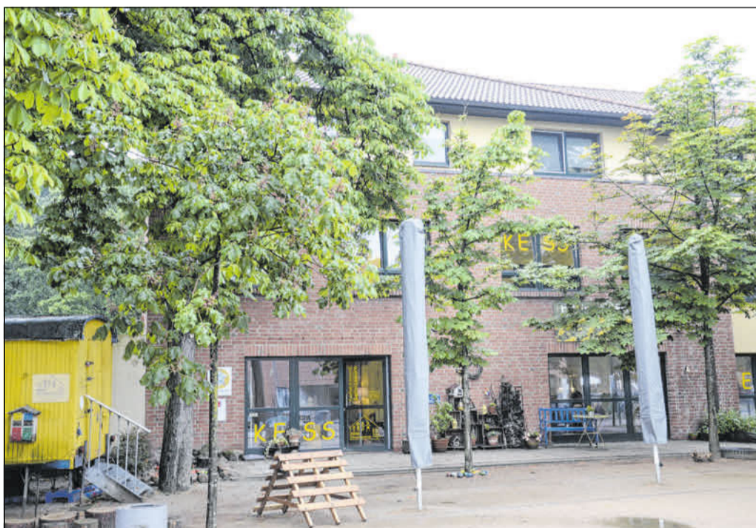
Im Rahmen der Jugendhilfeausschusssitzung wurde unter anderem das Projekt „Stipendiaten“ des KESS vorgestellt.