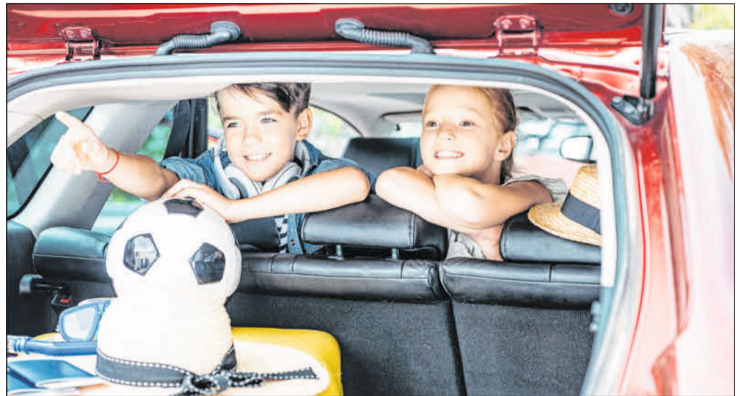
Alles im Kofferraum verstaut - und schon kann es losgehen. Gut 50 Prozent der Urlauber nutzen laut ADAC das Auto für die Anreise zum Urlaubsort.