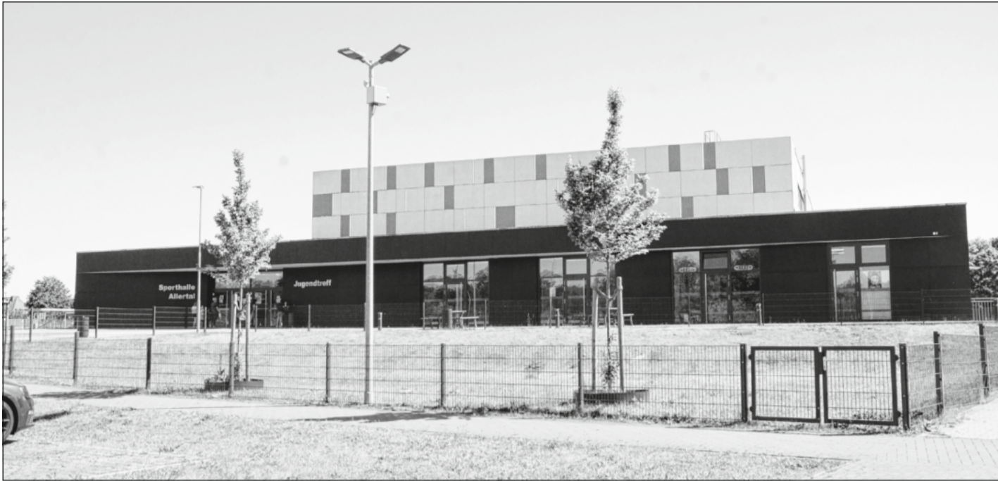
Das große Sommerfest der Gemeinde Winsen (Aller) und des Landkreises Celle findet rund um die Sporthalle am Allertal statt.