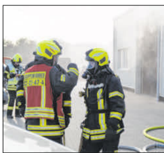
Ein Übungsbrand in einer Werkstatt.

Nach etwa einer Stunde konnte laut der Feuerwehr das gesamte Szenario abgearbeitet werden und die Freiwilligen konnten nach Hause zurückkehren.