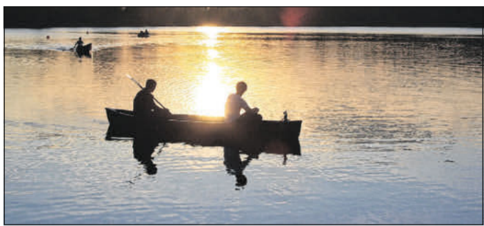
Kanu fahren im Sommer.