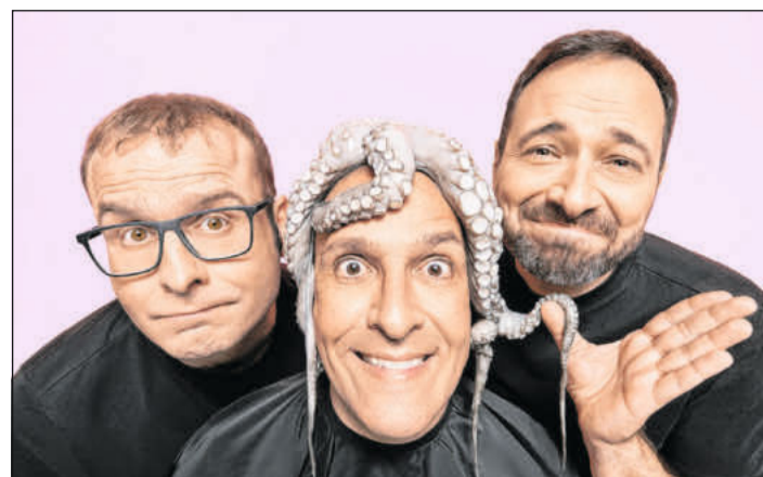
Das Trio „Eure Mütter“.