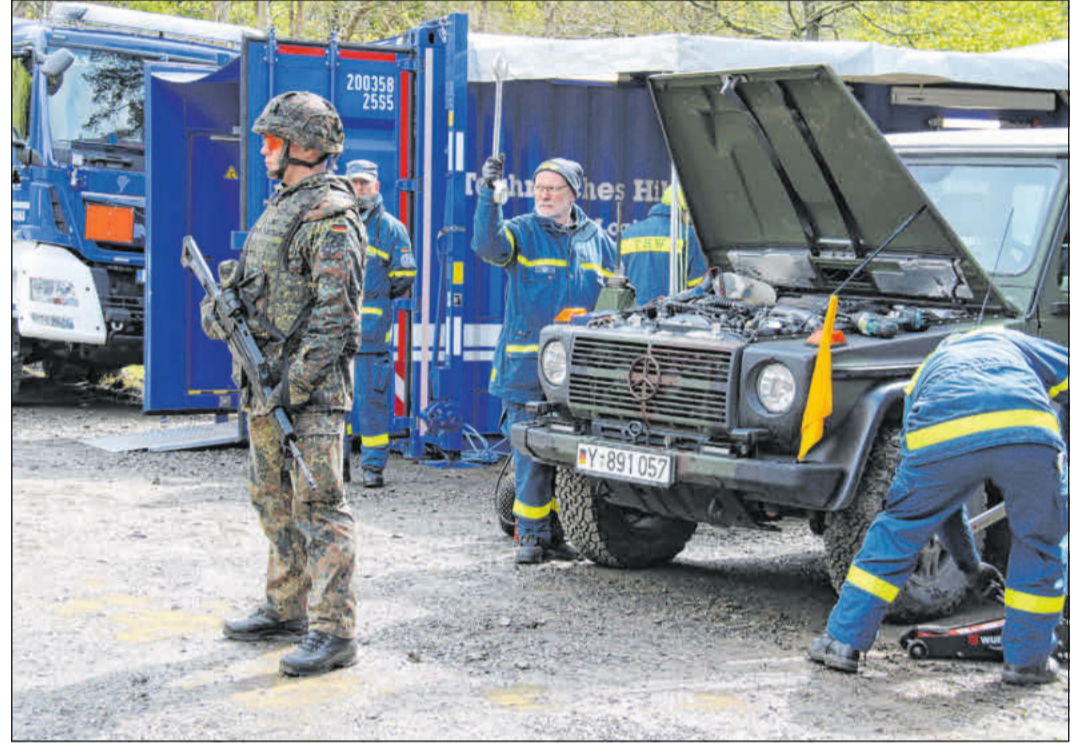
Während der Übung.

Die Übung war ein voller Erfolg und verdeutlichte die Bedeutung der Zusammenarbeit zwischen den verschiedenen Akteuren im Bereich der Notfallvorsorge.