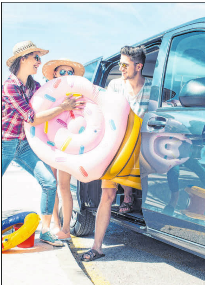
Vor dem Urlaubsantritt auch den Versicherungsschutz prüfen.

Wichtig zu wissen: Der Versicherer kann einzelne Länder aus dem Versicherungsschutz herausnehmen. Diese sind dann auf der Grünen Karte durchgestrichen. Vor der Einreise muss dann eine so genannte Grenzversicherung für das Fahrzeug abgeschlossen werden.