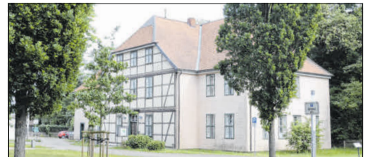
Das Amtshofgelände in Groß Eicklingen.

Hier tauscht man Termine aus, berät gemeinsam über Dinge, die über das „Alltagsgeschäft“ eines jeden Vereins hinausgehen und hier hält man vor allen Dingen auch den direkten Draht zur Kommune.