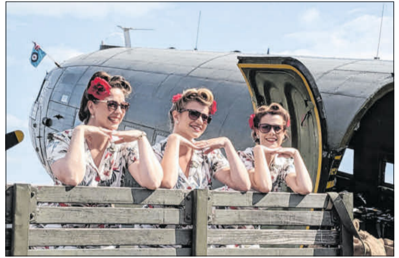
„Fox, Wiggle & Sass“.

Im Jahr 2024 jährt sich das Ende der Luftbrücke Berlin zum 75. Mal und dieses Ereignis soll gebührend gefeiert werden. Der Fliegerhorst Faßberg war für die Luftbrücke einer der wesentlichen Flugplätze. Aus diesem Grund wird es am Freitag, 7. Juni, um 10 Uhr eine Gedenkveranstaltung auf dem Platz der Luftbrücke im Herzen der Gemeinde Faßberg geben. Auf dem Platz der Luftbrücke im Herzen der Gemeinde Faßberg wird es nicht nur eine entsprechende Gedenkveranstaltung geben, sondern auch ein abwechslungsreiches und tolles Rahmenprogramm an der „Oase“. Am Freitagabend werden „Fox, Wiggle and Sass“ das Konzert mit der U.S. Air Force Band Europe um 19 Uhr am Soldatenheim „Oase Faßberg“ eröffnen.