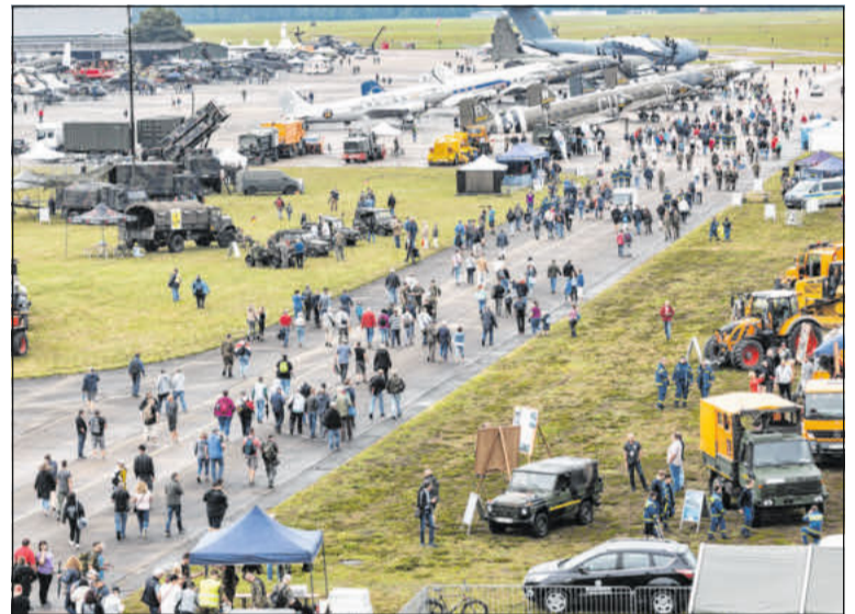
Beim Tag der Bundeswehr 2019.