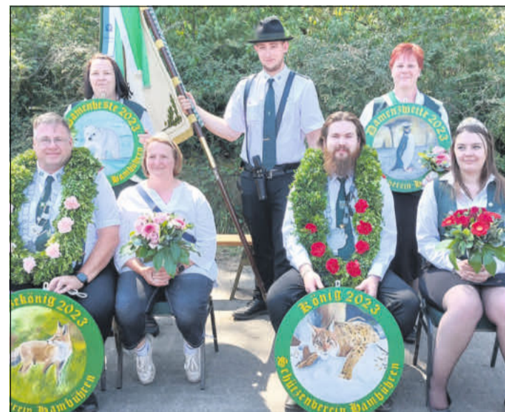
Die Majestäten des Jahres 2023 verabschiedeten sich.

Die neuen Majestäten werden am Sonntag, 9. Juni, ab 11.30 Uhr auf dem Hermann-Meine-Platz bekannt gegeben. Anschließend folgt der Festumzug zum Anbringen der Königsscheiben. Derweil steigt ab 15 Uhr im Festzelt der beliebte Kindertanz sowie die große Kaffeetafel. Nach dem Eintreffen des Umzugs gegen 16.30 Uhr gibt es noch reichlich Musik von den Spielern im Zelt. Erstmals wird am Sonntag unter Schützen, Gästen, Schaustellern und Bürgern die „Festplatz-Majestät“ an der Schießbude ausgesprochen. Nach dem Fahnenausmarsch beginnt ab 19 Uhr der Königsball mit DJ Dancefloor und um 20 Uhr erfolgt die Proklamation des Festplatzkönigs.