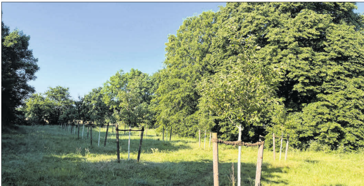
Die Streuobstwiese in Klein Hehlen.