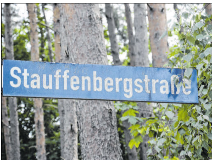
Die Straßen mit Namen von Widerstandskämpfern sollen zusätzliche Schilder zu Erläuterung bekommen.

„Wir bemühen uns sehr, dass wir den Leerstand in Klein Hehlen niedrig halten“, so Abenhausen abschließend.