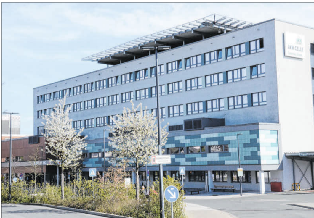
Der Landtag beschäftigte sich mit der zukünftigen Ausgestaltung der Krankenhauslandschaft in Niedersachsen.