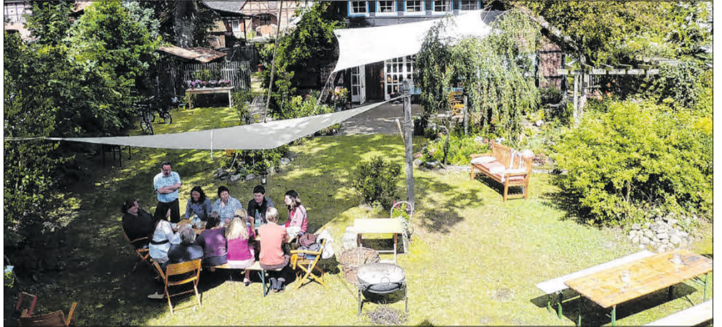
KunstRaum Alte Dorfbäckerei, Nienhof.