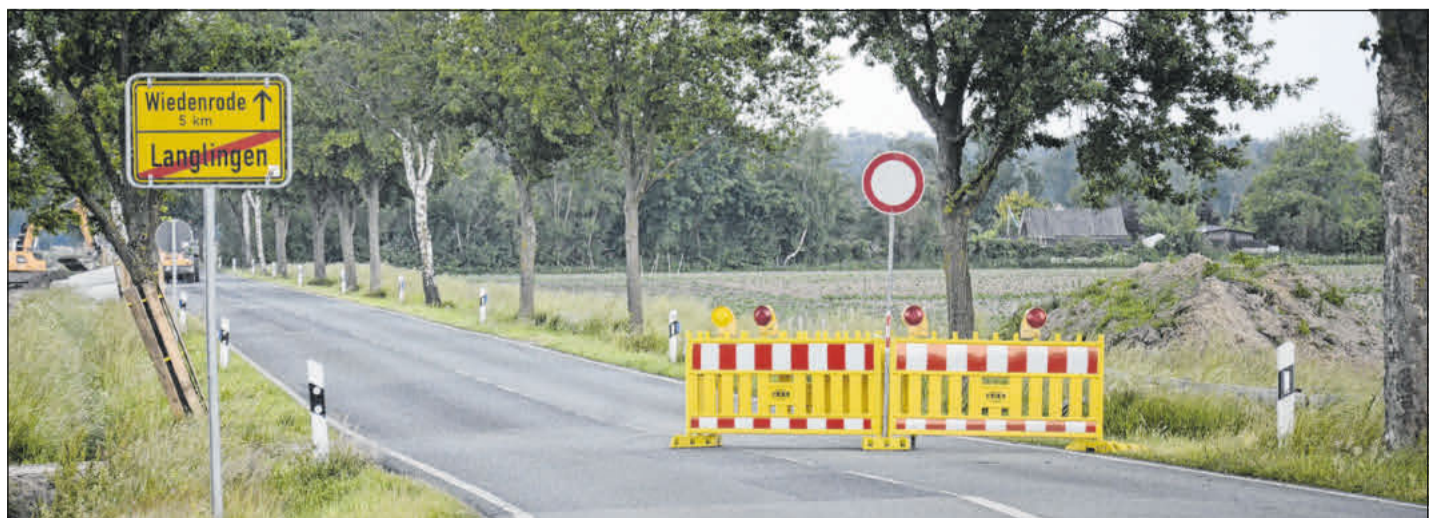
Entlang der Kreisstraße 51 zwischen Langlingen und Wiedenrode wird ein Radweg gebaut.

Der Landkreis ist gemeinsam mit den Beteiligten bestrebt, einen reibungslosen Bauablauf zu erreichen und die negativen Auswirkungen auf die Anwohner so kurzfristig und so gering wie möglich zu halten.