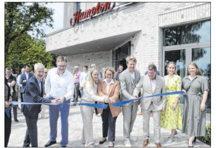
Das Hampton by Hilton wurde offiziell eröffnet.

Auf der Nachbarbaustelle zeichnet sich ein ebenso guter Verlauf ab. Die Fertigstellung des Wohnungsbaus ist im Mai 2025 geplant.