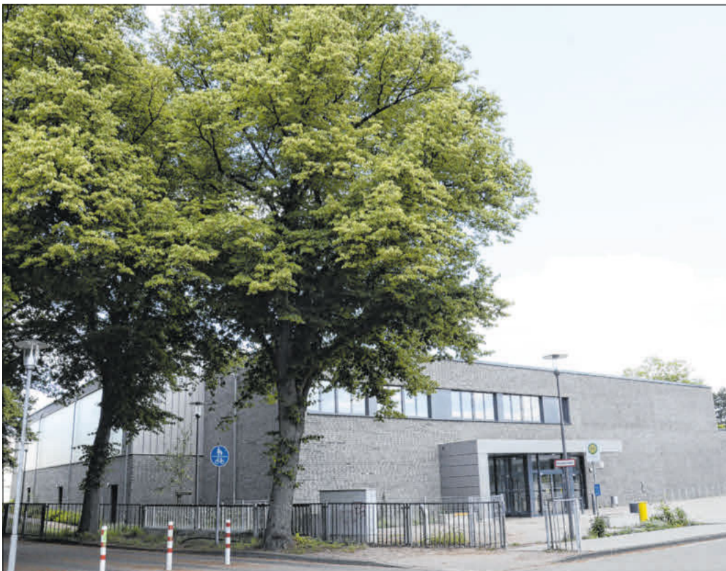
Beim Landkreis Celle können jetzt Hallen online gebucht werden.

Für Fragen und weitere Informationen steht die Sportförderung des Landkreises Celle gerne unter Telefon 05141/9162109 (Herr Heße) und 05141/9162110 (Herr Bornheber) zur Verfügung. Gerne kann man sich auch per Mail an Sportfoerderung@lkcelle.de wenden.