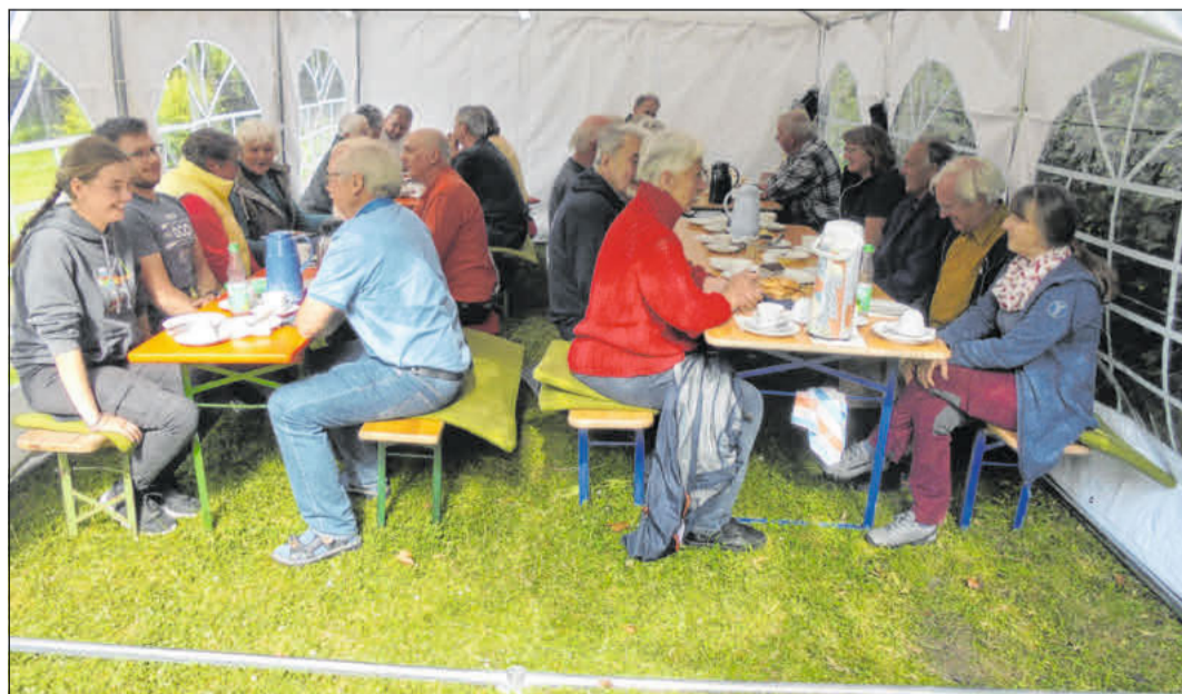
Die Kanu-Gesellschaft beim Sommerfest in ihrem neuen Festzelt.

Noch lange saßen die Wassersportler in ihrem Zelt an diesem langen und warmen Sommerabend zusammen, tauschten Gedanken aus und schmiedeten Pläne für weitere Unternehmungen.