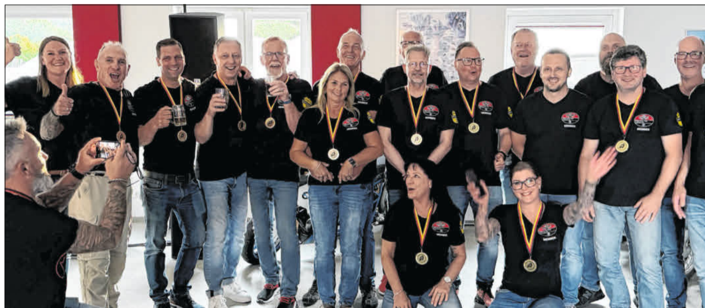
Der BMW Boxerclub Eschede e.V.

Busse startete auch über die Rücken-Strecken. Eine Top-Ten-Platzierung gelang ihr über 200-Meter-Rücken in 2.52.36 Minuten. Für die Freistil-Strecken entschied sich Krauß. Ihre beste Platzierung hatte sie über 100-Meter-Freistil. Um fast vier Sekunden steigerte sie ihre Bestform und belegte Platz neun mit 1.09.89 Minuten.