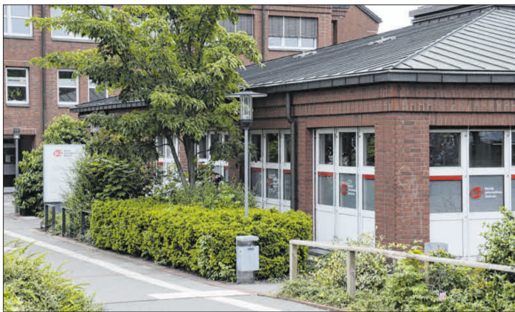
Auch über 18-Jährige können Kindergeld erhalten.

einschließlich deren Ergebnissen. Aus diesen muss der Ausbildungs- oder Studienbeginn hervorgehen, der sich zum Beispiel in Ausbildungsverträgen, Immatrikulations- oder Schulbescheinigungen findet. Das Online-Angebot unter www.familienkasse.de ermöglicht es, Mitteilungen und Nachweise, wie zum Beispiel über den Ausbildungs- oder Studienbeginn sowie Schulbescheinigungen, bequem und komplett online an die Familienkasse zu übermitteln. Gleiches gilt für den Antrag auf Kindergeld ab 18 Jahren. Eine Arbeitslosmeldung ist in diesem Zeitraum nicht erforderlich.