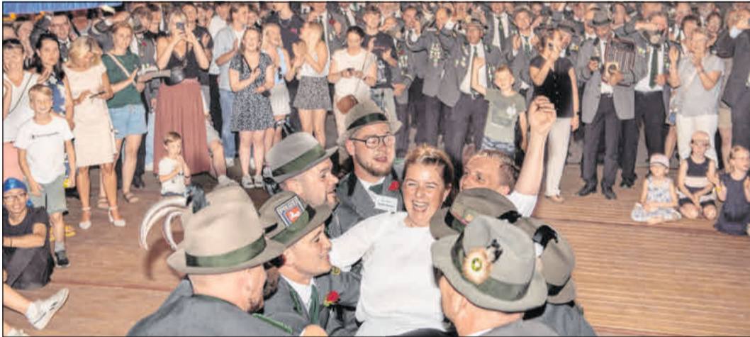
In Bergen werden am kommenden Wochenende die neuen Majestäten proklamiert.

Der Samstag, 6. Juli, startet etwas später um 12.30 Uhr mit einem Platzkonzert auf dem Marktplatz. Es spielt der Spielmannszug der Schützengilde Sülze. Um 12.45 Uhr trifft das Schützenkorps am Rathaus ein. Der Festumzug der Kinder beginnt dann um 13 Uhr. Von 14 bis 16 Uhr sind Kinder zu Spielen und Vogelstechen auf dem Festplatz eingeladen, für Jugendliche und Junioren wird ein Schießen in der Schießsportanlage Heisterkamp angeboten. In