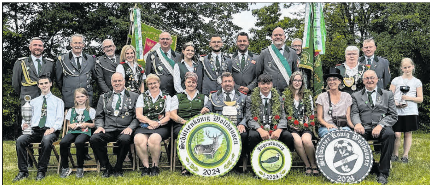
Der Hofstaat der Schützen Wolthausen.