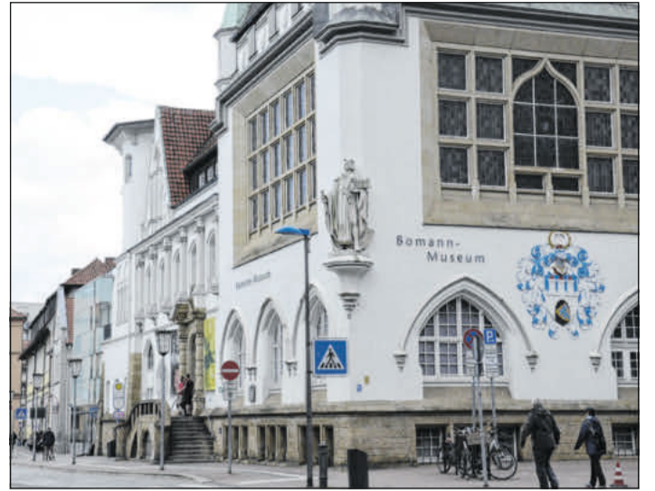
Das Bomann-Museum in Celle.

Das Gruppen-Karaoke-Event Herdensingen findet