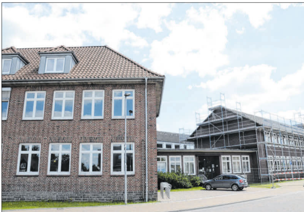
Ein großes Problem bleiben die Abordnungen. Viele Ober- und Realschulen müssen Lehrkräfte an Grundschulen abordnen.

Urkunden gab es für besondere schulische Leistungen und besonderes soziales Engagement. „Wir möchten damit ausdrücken, dass Schule sich nicht alleine um Noten, sondern auch um viele andere Dinge dreht, die eben auch wichtig sind“, sagte Flader bei der Begrüßung der Schülerinnen und Schüler im Saal des Schlosstheaters. Dort gab es einen Empfang und das Theaterstück Tartuffe.