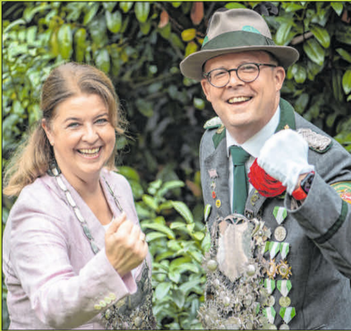
In Bergen wird wieder Schützenfest gefeiert.