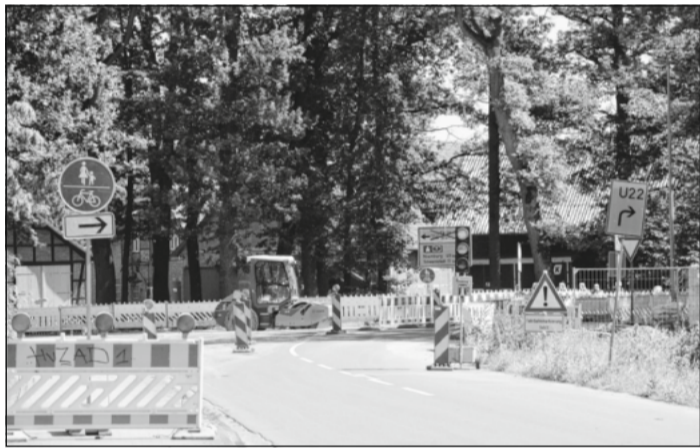
Bei der Ortsdurchfahrt Jeveresen verzögern sich die Arbeiten.

Der Geschäftsbereich Verden der Niedersächsischen Landesbehörde für Straßenbau und Verkehr bittet die Bauverzögerung und die damit verbundenen Einschränkungen zu entschuldigen, dankt allen Anwohnern und Verkehrsteilnehmern für ihr Verständnis und bittet gleichzeitig um erhöhte Aufmerksamkeit im Baustellenbereich sowie auf den Umleitungsstrecken.