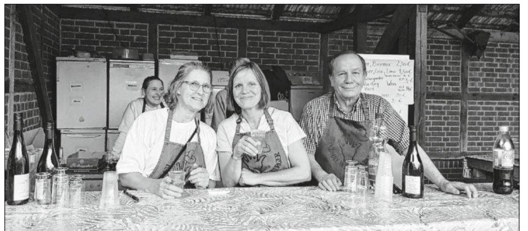
Die Wieckenberger hatten ein breites kulinarisches Angebot.

Die Handvoll werden wieder von sich hören lassen, spätestens beim beliebten Jazz-Frühstücken am Sonntag, 25. August, auf dem Kothenhof. Die Big Band Celle und die Handvoll freuen sich schon jetzt.