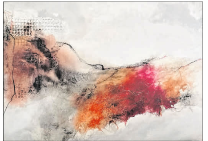
Ein Werk aus der Ausstellung.

Besucher sind am Eröffnungstag eingeladen. Die Gemälde von Giese kann man danach noch bis zum Herbst auf der Ausstellungsfläche zwischen Altbau und Hochhaus montags bis donnerstags von 9 bis 15 Uhr und freitags von 9 bis 12 Uhr sehen.