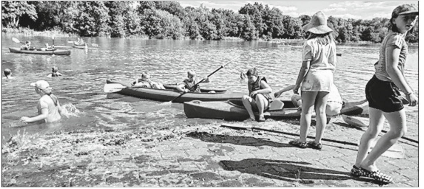
In der vergangenen Woche fand die Aktion „Kanufahren auf dem Heidesee“ statt.

neuen Stadtteil: Foyer und Kirchensaal bilden den Hauptbaukörper, im Nebentrakt sind Unterrichtsräume und Sakristei untergebracht, zur Straße hin vorgelagert sind Garderobe, WC's und Technikräume. Foyer und Kirchensaal beziehen ihre räumliche Spannung aus der Geometrie des Baukörpers, die sich unter anderem aus der Schrägstellung des Firstes gegenüber den Längswänden ergibt. Die schräg angeordnete Innenwand schafft ein sich nach hinten verjüngendes Foyer und einen sich zum Altar aufweitenden Kirchensaal.