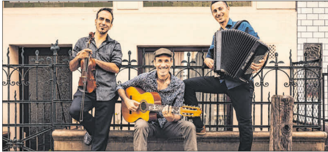
Am Donnerstag, 25. Juli, um 20 Uhr, tritt das argentinische Trio „Tzigan“ in der CD-Kaserne auf.

„Kings of Floyd“ machen mit ihrer Eclipse-Tour am Freitag, 25. Oktober, um 20 Uhr Station in Celle.